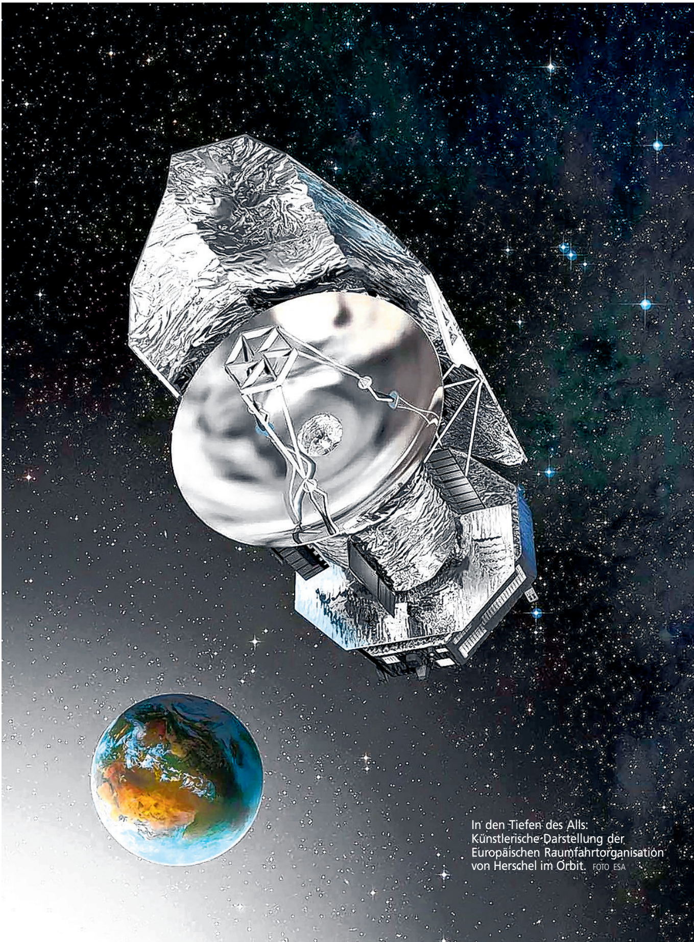
In den Tiefen des Alls: Künstliche-Darstellung der Europäischen Raumfahrtorganisation von Herschel im Orbit.